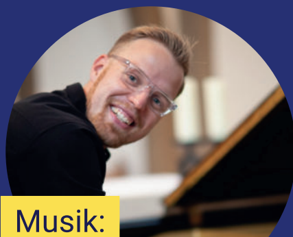
Musik: JENS NIEMANN

Anmeldungen in den Gemeindebüros (05405 6191910 / 05405 3302)