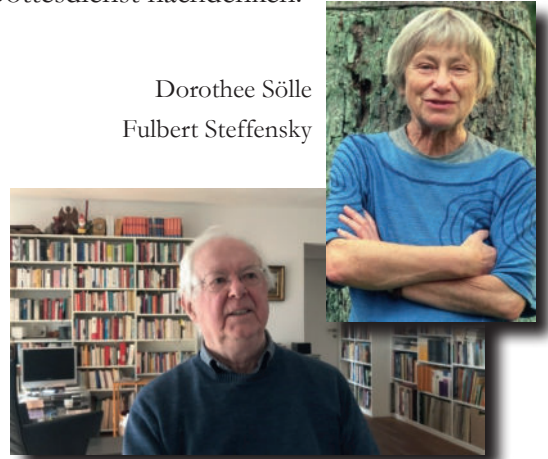
Dorothee Sölle Fulbert Steffensky

sind und an der andere Menschen hängen. Es geht um die Kirche, die manche Menschen verlassen. Um die Kirche, in der andere Menschen bleiben und Verantwortung übernehmen. Die Theologin Dorothee Sölle und ihr Ehemann, der Theologe Fulbert Steffensky, haben in vielen Diskussionen um die Kirche gerungen. Kritik an der Kirche, Liebe zur Kirche – das bewegt auch viele Menschen heute in Hasbergen und in anderen Gemeinden. Steffensky schreibt: „Wir brauchen die Gemeinschaft der Heiligen, auch wenn die Heiligen mit Fehlern behaftet und die Gemeinschaft manchmal brüchig ist.“ Darüber wollen wir in diesem Gottesdienst nachdenken.