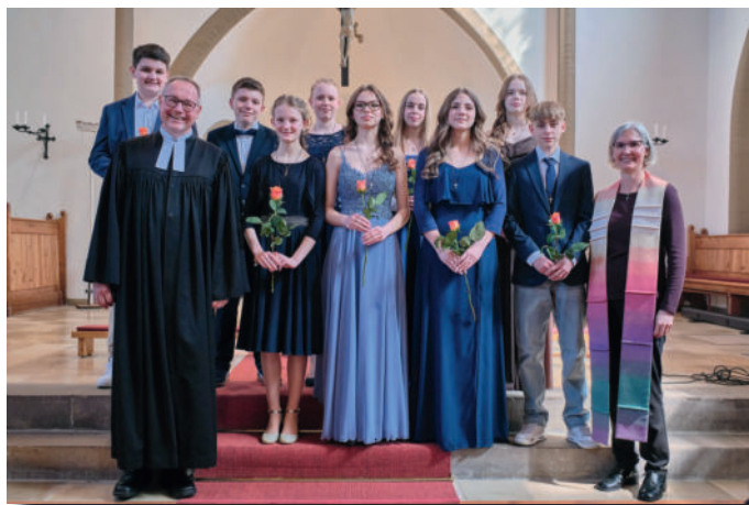
Samstag, 25.04.2026, 14h