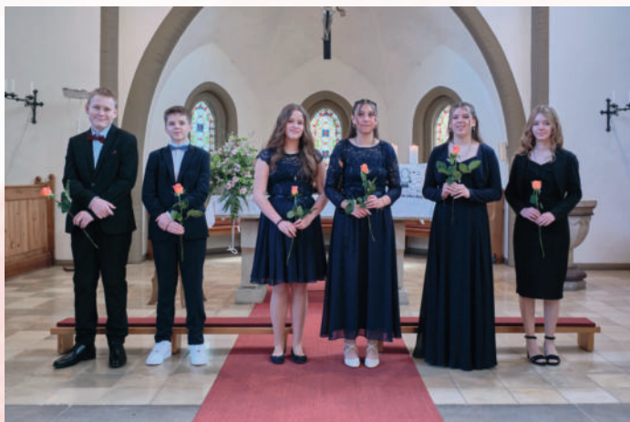
Sonntag, 26.04.2026, 10h